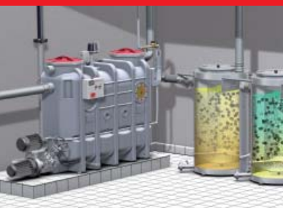
ACO Hochleistungsbiologieanlage BIOJET