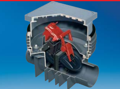
ACO Fäkalienrückstauautomat QUATRIX