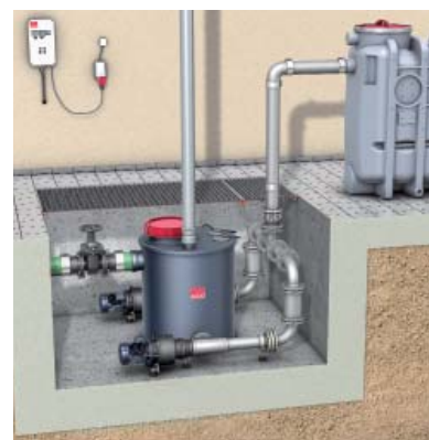
Technische Schulungen bieten Raum, interessante Sonderlösungen zu thematisieren