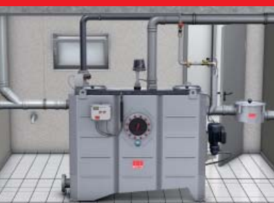
ACO Fettabscheider LIPURAT OS