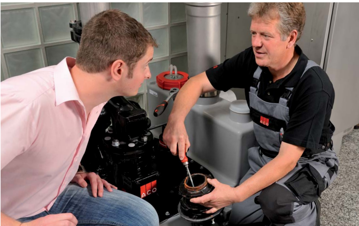
ACO Servicemitarbeiter sind für Sie rund um die Uhr einsatzbereit