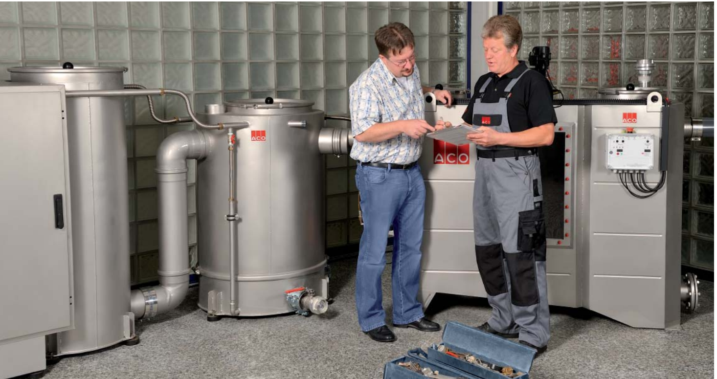
Genaueres Führen des Betriebstagebuches und sorgfältige Inspektion sichern die Langlebigkeit Ihrer Anlage