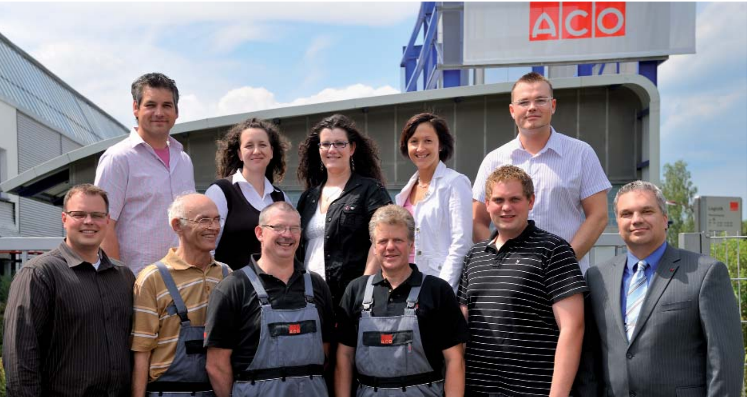
Das ACO Serviceteam