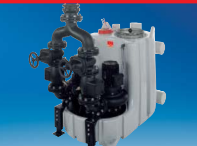
ACO Hebeanlage MULTI-PRO PE