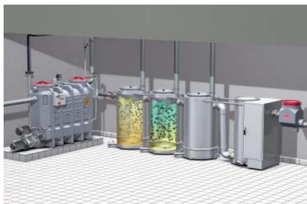
In den technischen Schulungen werden u. a. auch Anwendungsbeispiele, wie hier die Nachbehandlung von fetthaltigem Wasser, vorgestellt